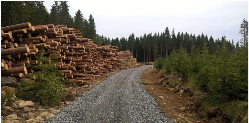
Mäyrämäen lohkon laanissa pitkäpino tukkeja, vieressä komeaa taimikkkoa.

Yhteismetsä on jäsenenä Osuuskunta Metsäliitossa sekä yhteismetsien edunvalvonta organisaatioissa Eteläisen-Suomen Yhteismetsissä, Päijät-Hämeen MHY:ssä ja MTK:ssa