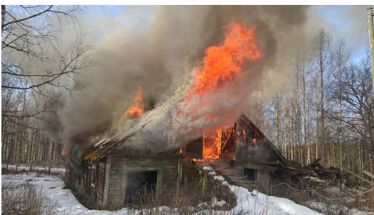
Niinimäen vanha navetta poltettiin ennen kiinteistön myyntiä

Yhteismetsä on jäsenenä Osuuskunta Metsäliitossa sekä yhteismetsien edunvalvonta organisaatioissa Eteläisen-Suomen Yhteismetsissä, Päijät-Hämeen MHY:ssä ja MTK:ssa